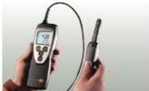
Sonda de humedad con empuñadura y cable