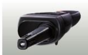
testo 625 con sonda acoplada