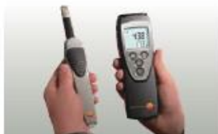
testo 625 con empuñadura con radio y módulo de radio