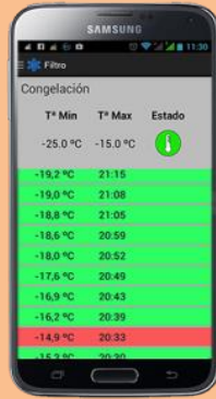
Listado de temperaturas de cada cámara