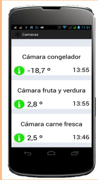
Temperatura online de las cámaras

REGISTRADOR Y AVISADOR DE TEMPERATURAS CON APLICACIÓN PARA MÓVIL (android e iOS)